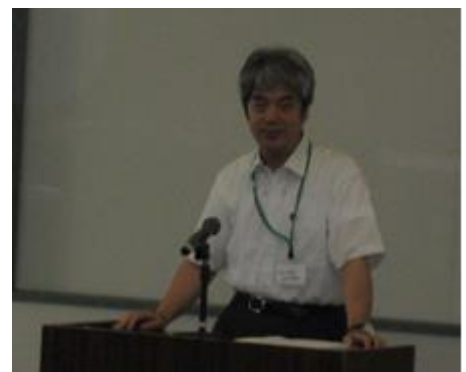
笠井明石高専校長